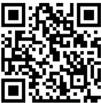
นโยบายข้อมูลส่วนบุคคล สำหรับสมาชิก