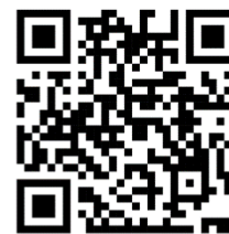
นโยบายข้อมูลส่วนบุคคลสำหรับ ผู้ใช้บริการเว็บไซต์ (Cookies Policy)